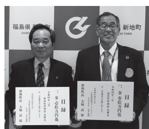
生活協同組合コープおおいた 大分県生活協同組合連合会