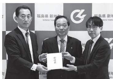
オリエンタルモーター（株）