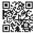
職場体験実習 QRコード