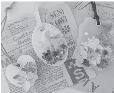
アロマワックスサシェ