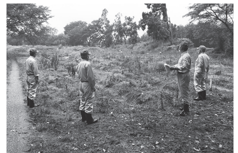
農地パトロールの様子