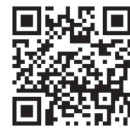
ホームページ QRコード