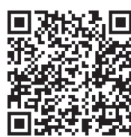
就職相談ページ QRコード