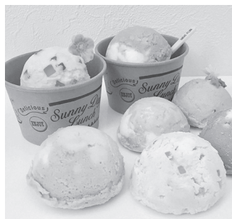
アイスクリーム石鹸