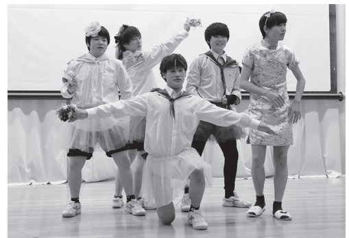
高校での思い出 (校内文化祭：仮装コンテストの様子)

私は、卒業後に専門学校へ通います。夢を実現するためにも、高校生活で学んだ、努力することの大切さを忘れず、頑張っていきたいと思います。