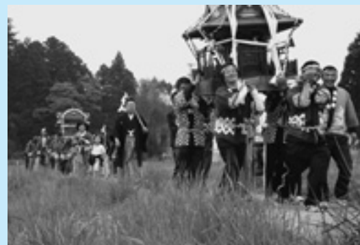
▲福田地区をわっしょいわっしょい

諏訪神社春の例大祭が5月3日に行われました。 祭典では、神楽師の子供たちと3基の御輿を担いだ氏子たちが、沢口、鉄炮町、明地、中里地区を威勢よく練り歩き、沢口と中里の公会堂で神楽を披露しました。 境内にある舞楽殿では、県重要無形文化財「福田十二神楽」の奉納も行われ、世代を超え、地域の伝統を守り続けています。 また、祭典には、新地町に工場を構える「福島ニチアス」のみなさんも参加し、大きなかけ声をかけながら御輿を担ぎ、地元住民らと交流を図り、地域のイベントに花をそえました。