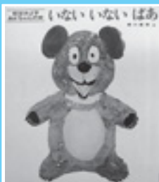
松谷みよ子/作 ※昔から広く親しまれている絵本です。