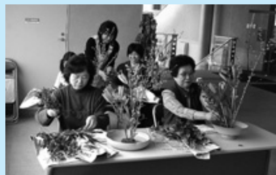
▲“本物”の華道を体験

新地町華道教授会主催の「第三回諸流合同いけばな展」が4月26日、27日に、新地町図書館で行われました。約20点程の個性あふれる作品が展示され、来場者を魅了しました。