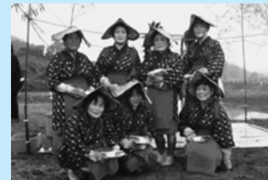
▲早乙女姿で田植えをしたみなさん

5月3日、福田地区の諏訪神社西で行われた田植え祭りには、多くの地元住民らが駆けつけ、昔ながらの伝統衣装を身にまとった早乙女姿の7人のみなさんが田植えを行いました。 11月3日には、収穫祭が行われる予定です。