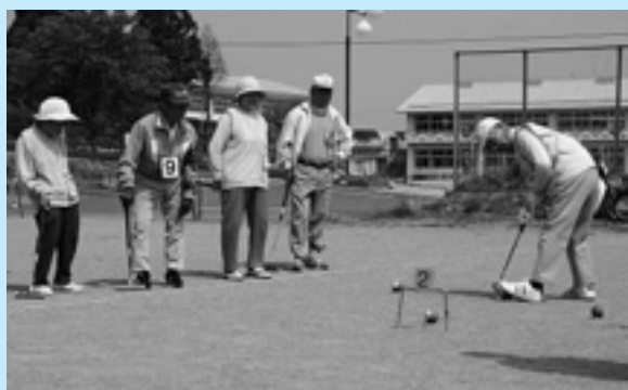
▲白熱した試合を繰り広げる選手の皆さん

第16回町老人クラブ連合会長杯ゲートボール大会が、5月16日児童館グラウンドで開催されました。9チーム50名が参加し、最年長の91歳の選手をはじめ、みなさんハツラツとプレーしていました。