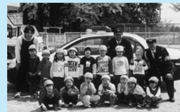
▲パトカーの前で、はいチーズ！

保育所の児童を対象とした交通安全教室が、4月22日、23日、24日に、駒ヶ嶺、福田、新地の各保育所で行われました。