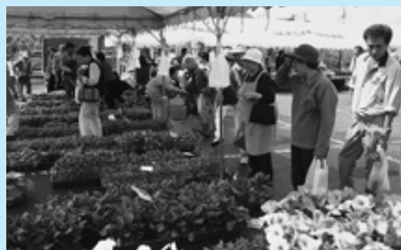
▲苗を買い求める来場者

第22回新地種苗市が、5月17日と18日の2日間にわたって農村環境改善センター前広場で開催されました。