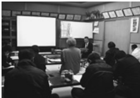
▲地区懇談会の様子

※「福島県津波浸水想定区域図等調査報告書」とは、市町が作成する津波ハザードマップの作成のための基礎資料であり、福島県全域を対象とした津波の浸水範囲、到達時間等のシミュレーションを行い、津波浸水想定区域図等を作成したものです。