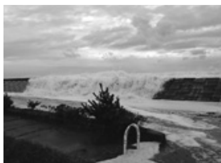
▲平成18年10月に発生した埴浜地区高潮被害

予測の結果福島県沖高角断層地震では、地震発生後40分過ぎに津波の影響が開始、60分過ぎに第1波の津波が到達するとされており、埴浜海岸や釣師浜漁港等が浸水する予想となっています。