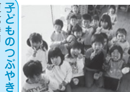
▲歯みがきの時間だよ

保育所では、毎年、歯科検診を行い虫歯予防に努めています。歯科衛生士による、歯科指導教室では、歯の汚れを赤く染め出して、正しい歯みがきの仕方を習得します。給食後の歯みがきもお気に入り歯ブラシとコップを使い行っています。口の中を清潔にする気持ちよさを伝え、楽しく歯みがきができるようにしています。