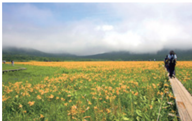
▲ニッコウキスゲの黄色のじゅうたん