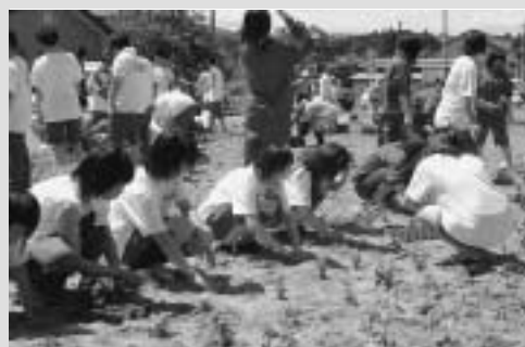
▲ 1本1本丁寧に植え付け

生徒らは、あらかじめ仮植しておいたフラワーポットから1本ずつ取り出して丁寧に植え付けていました。