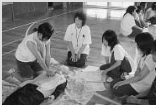
▲ 心臓マッサージを行う生徒

また、小川地区でも13名が6月27日、同様に講習会を受講し、応急処置や救急時の対応について学びました。