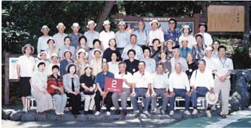
▲三保の松原での集合写真