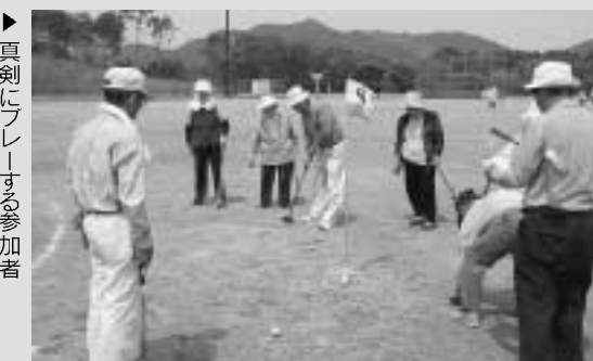
▶ 真剣にプレーする参加者