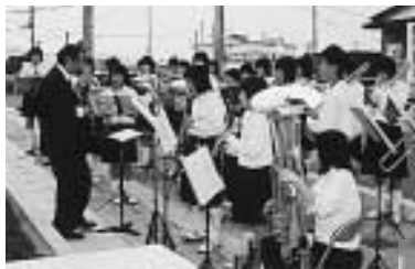
▲ 尚英中吹奏楽部のみなさん