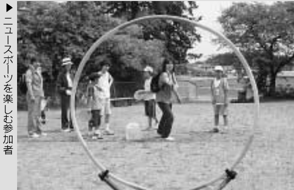
▶ ニュースポーツを楽しむ参加者