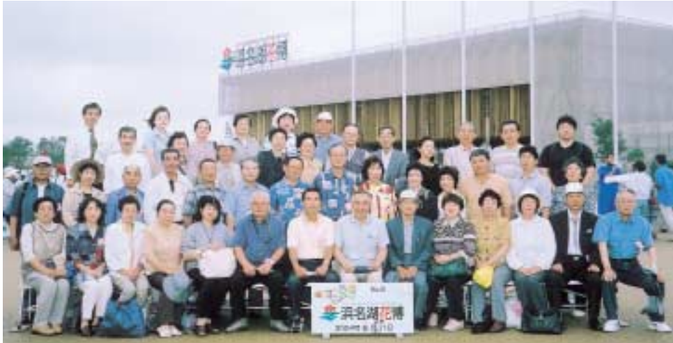
▲浜名湖花博での集合写真