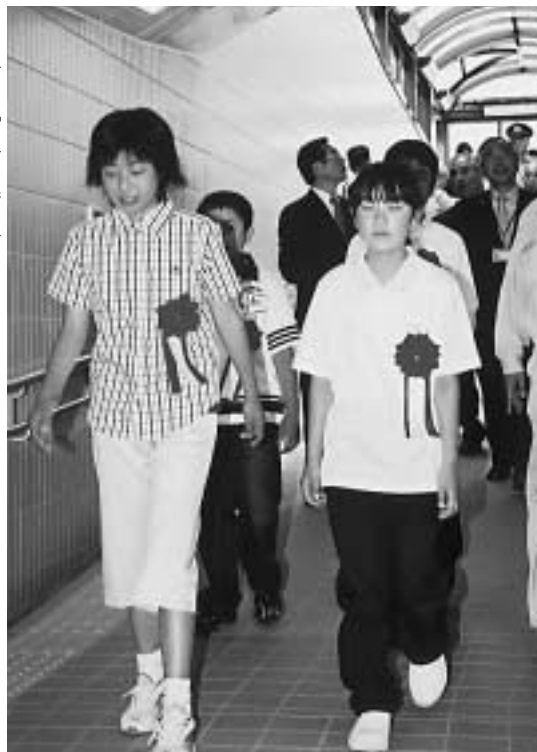
▶ 通り初めをする参加者たち

「新地地下道」概要 地下道整備にあたり、地域住民の意見を反映するため、懇談会が4回行われました。地下道は高齢者や障害者に配慮し手摺りや車いすでも簡単に通行できる緩やかな斜面になっています。防犯対策として防犯カメラとカーブミラー、非常時に備え非常ボタンを配置。また、地下道内には地域の情報が発信できるよう掲示板が設置されています。