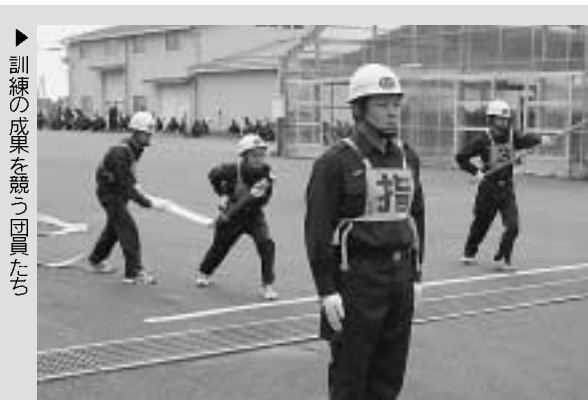
▶ 訓練の成果を競う団員たち