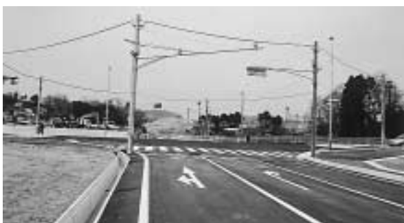
▲3月に完成した福倉地内交差点

各法令に基づいて整備を進めております。県道については、福島県に対し、整備促進を要請してまいります。