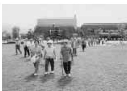
広さ17haの「だて歴史の杜」