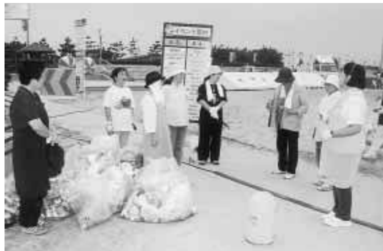
町民の翼「ひまわり会」が4日の早朝、海岸を清掃