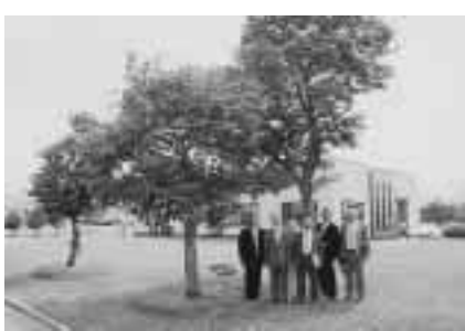
第1回町民の翼「マロニエの会」が伊達市へ寄贈した柿の木