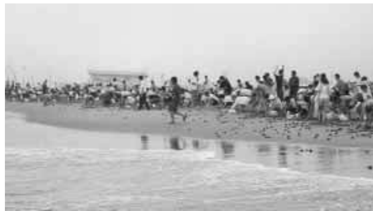
恒例のホッキ狩り