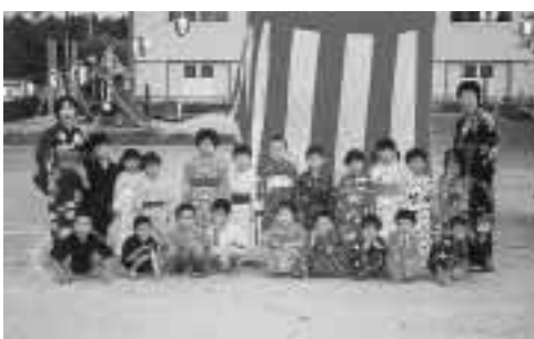
楽しかった夏まつり