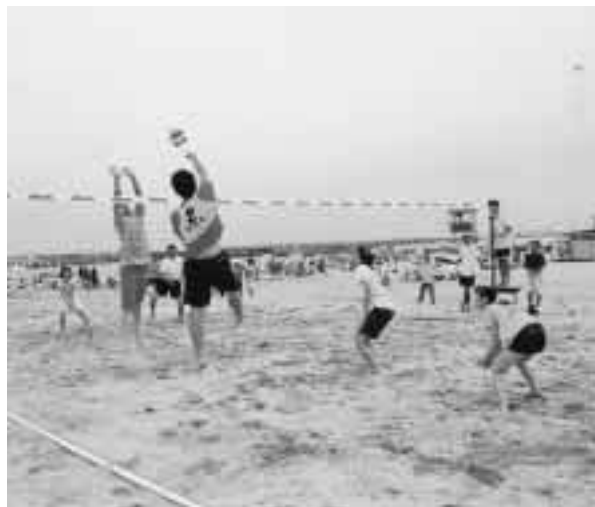
熱戦をくりひろげたビーチバレー(上)と ビーチサッカー(下)