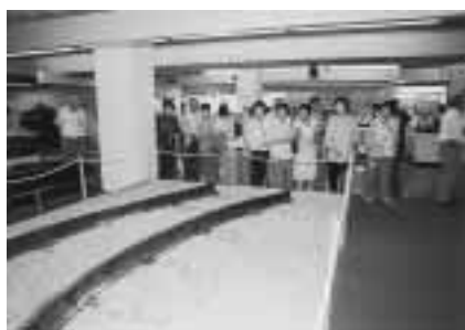
虹田町火山科学館を見学