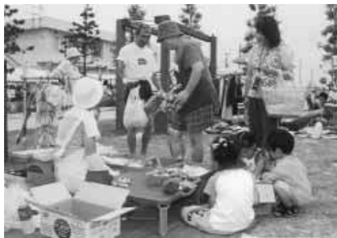
好評のフリーマーケット