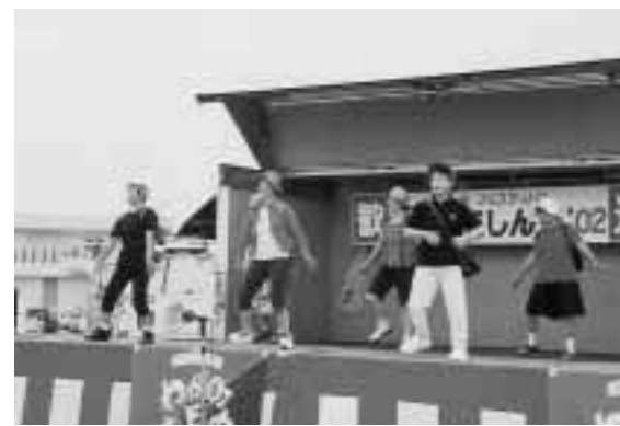
婦人会によるステージイベント