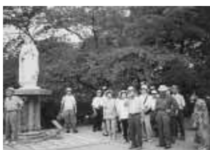
トラピスチヌ修道院を見学