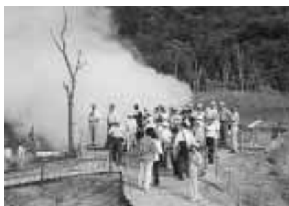
現在も噴気が上がっている西山火口