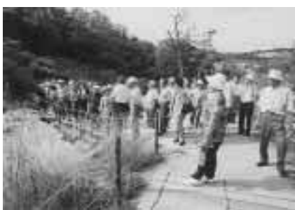
噴火によって隆起した道路