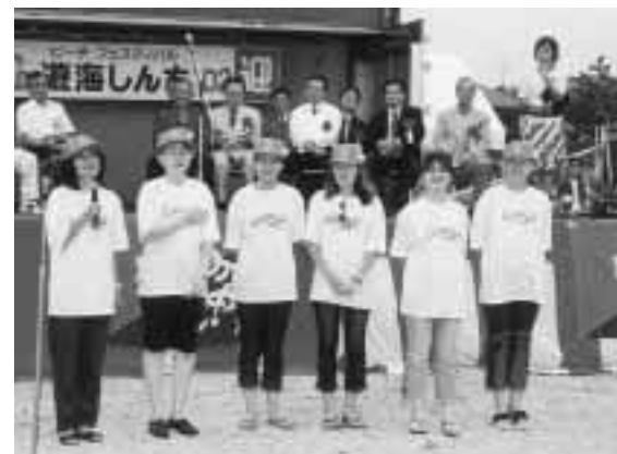
ウズベキスタンの留学生も新地の海を満喫