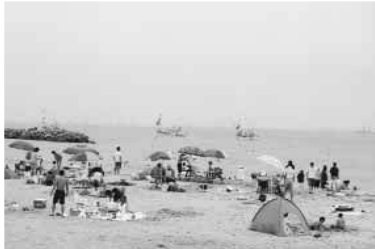
大漁旗を掲げ勇壮に漁船パレード