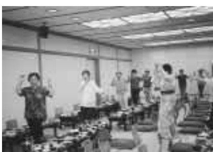
懇親会の締めは全員での相馬盆踊り