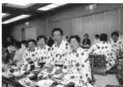
親睦を深めた懇親会