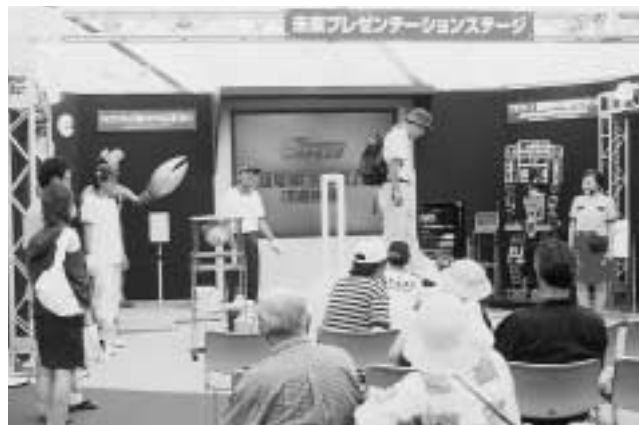
▲ウルトラマンが目印の「未来産業館」。最先端のロボットや浮遊体験など近未来が体験できます。