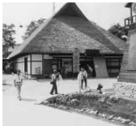
▲昔懐かしい民話が聞ける「からくり民話茶屋」。いろいろ端でおはあさんたちが福島県の文化を伝えます。