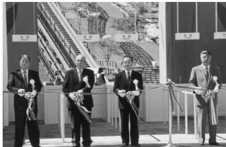
▲荒町長らのテープカットによって「未来博」がオープンしました。