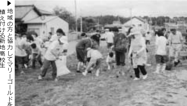
▶地域の方と協力してマリゴールドを植え付ける新地高校生

地域を花で彩る 新地高校生らが 花いっぱい運動に参加 新地高校生70人と第8行政区の役員や婦人会、老人クラブ約30人は7月6日、町が推進している花いっぱい運動の一環として小川地区の国道6号沿いの緑地帯にマリゴールド3千本を植栽しました。植栽したマリゴールドは6月に新地高校生が学校の温室に仮植したもので、参加者たちは1本づつ丁寧に植え付けていました。