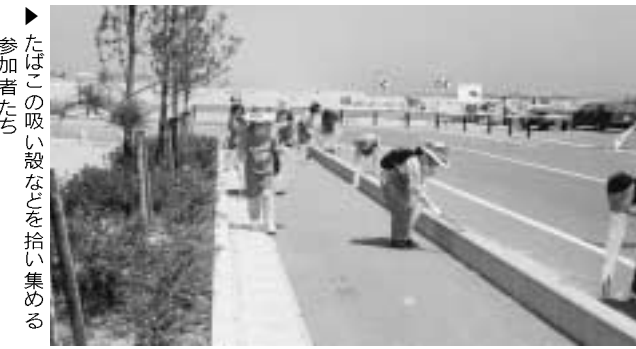
▶たばこの吸い殻などを拾い集める参加者たち

たばこ販売協同組合が 吸い殻清掃 原町たばこ販売協同組合に加盟する町の組合員17名が、7月3日、たばこの投げ捨て防止のスムーズキンクリン活動を行い、釣師浜海水浴場周辺を清掃しながら喫煙マナーの向上をアピールしました。会員たちはそろいの緑のエプロン姿で、マナーの悪い喫煙者が投げ捨てたたばこの吸い殻などを拾い集め、マナーを守った喫煙を呼びかけていました。