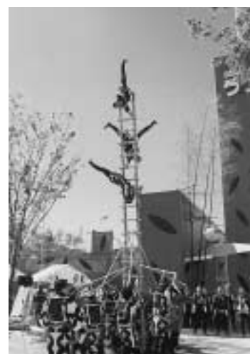
▲開場前には未来博期間中の安全を祈願して「はしご乗り」が行われました。