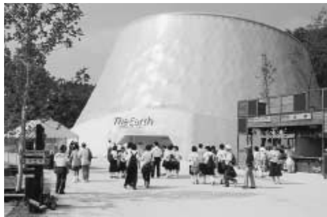
▲一番人気の「水の惑星ジ・アース」。地球46億年の歴史を体感できます。