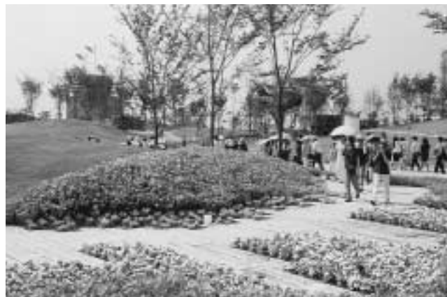
▲会場内は緑がたっぷり。木々や草花が来場者をなごませます。