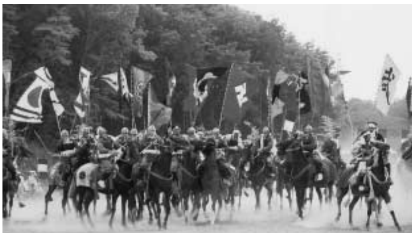
▲未来博のオープニングは「相馬野馬追」が飾りました。大迫力の戦国絵巻に来場者は大きな歓声を上げていました。