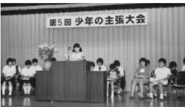
▶将来の夢を発表する参加者

第5回少年の主張大会 少年たちの夢を発表 児童、生徒たちが日ごろ感じていること、将来の夢や希望などを発表し、青少年の健全育成を深めてもらおうと、「第5回少年の主張大会」が7月21日、農村環境改善センターで行われ、児童生徒18人がそれぞれの考えを発表しました。 参加者たちは、家族や友人、将来の夢、社会問題などについて発表し、社会の一員としての自覚を深めていました。