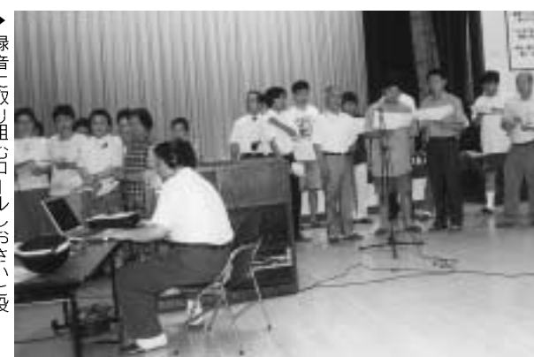
▶録音に取り組み「おさいと役場男性職員」

「町の歌」CD完成 町教育委員会では「町の歌」のCDをお母さんコーラス「おさいと役場」などの協力で7月5日録音し、このほど完成しました。 録音は「おさいと役場」のほか男声部門を役場職員が担当し、パソコンを使いながらの手作り、女声・混声・ピアノ伴奏のみなど数種類のパターンをCDに保存しました。完成したCD版「町の歌」は今後、各種会合などで利用していきます。