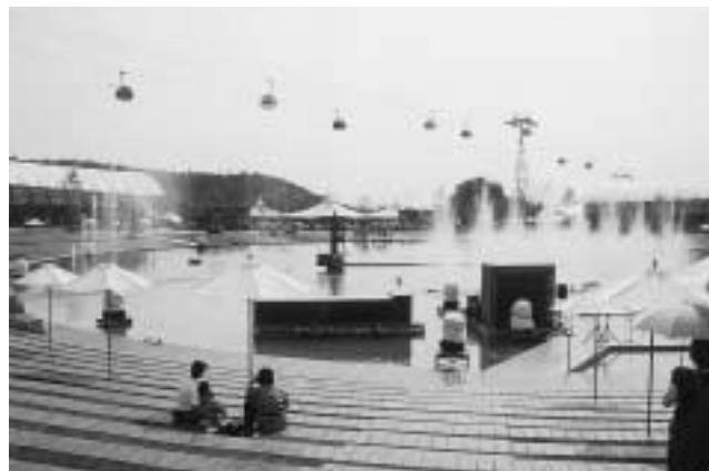
▲虹の台地中央の「集いのみずうみ」。7月20日からは、水と光、映像と音楽の大スペクタクル「うつくしまナイトファンタジア」が連夜開催されています。