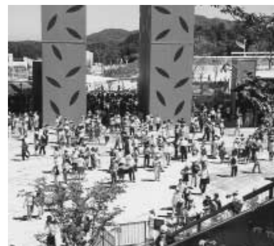
▲開幕直後の会場内は人・ひと・ヒトであふれました。