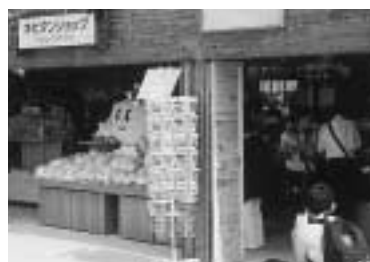
▲「キピタンショップ」ではキピタングッズがすべて揃います。

未来博は、森の中のバラエティー豊かな29のパビリオンから成り立っています。各パビリオンでは、自然や環境との共生を学んだり、21世紀の新技术・新製品の紹介など、参加・体験・交流を重視しています。魅力いっぱいの未来博「森の宝島」をお楽しみください。