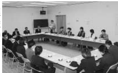
▶交流を深めた団員たち

新潟県豊栄市の女性消防団が10月18日、研修事業として来町し、町女性消防団と意見交換をして交流を深めました。豊栄市の女性消防団は13人で、普段は、消防本部の支援活動や自治会への応急救護指導、保育園・幼稚園での防火指導など地域で活発に防火活動を行っています。意見交換会では、お互いの活動内容や活動していく上での課題などについて活発に意見交換がされ、有意義な交流会となりました。