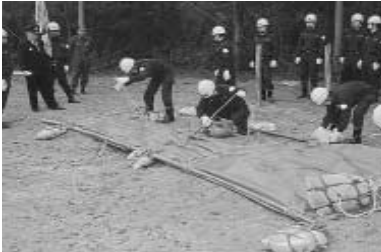
▶機敏な動作で演習を行う団員たち 右…中継放水訓練・斉放水 左…水防訓練・下…ポンプ操作

平成12年度町消防団秋季演習が10月29日、駒ヶ嶺小学校で、消防団員、婦人消防隊約350人が参加して行われました。演習では、火災が多く発生するこれからの季節に備え、通常点検や機械器具点検、ポンプ操作、中継放水訓練、婦人消防隊による一斉放水、水害などに備えた積土の工法による水防訓練の演習を団員たちは機敏な動作で行いました。演習の最後には、駒ヶ嶺地区を行進し、火災予防を呼びかけました。