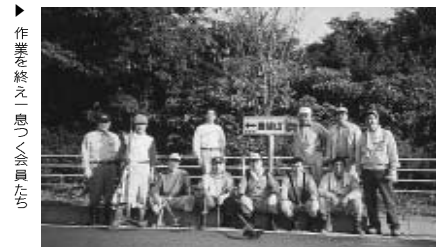
作業を終え一息つく会員たち