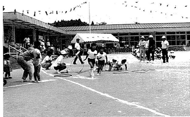
▲障害物競争(福田保育所運動会6%)