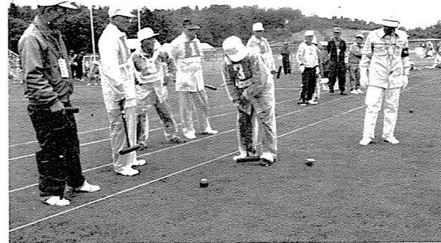
▲健闘した中里チーム

第四回日赤有功杯相馬地方ゲートボール大会が6月11日新地町民グラウンドで開かれ、町内から6チームが参加、中里チームが決勝トーナメントに進出したが入賞ならず。