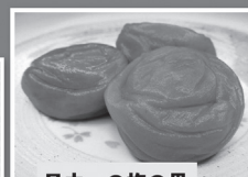
日本一の梅の里 和歌山県みなべ町！

浜焼き、漁船パレード、ビーチイベントなど 夜には花火打ち上げも！ しんちの海と夏をとことん楽しもう！