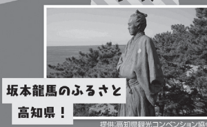
坂本龍馬のふるさと 高知県！