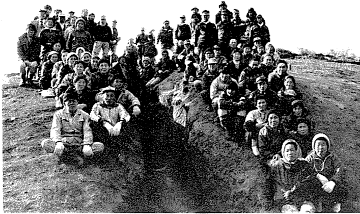
発掘調査に参加された方々 (向田D炭窯)

福島県文化センターが実施いたしました相馬地域開発地内の埋蔵文化財の発掘調査は、町民のみならずのご理解とご協力により、昨年十二月二十七日今年度分を無事終了することができました。心より御礼申し上げます。