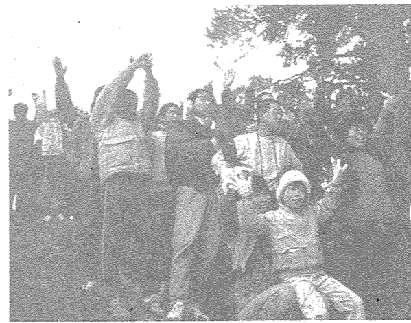
▲ 元朝鹿狼山登山に600人が参加

トピックスは、町内での話題をカメラレポートするコーナーです。みなさんのまわりにある話題を、役場総務課までお寄せください。