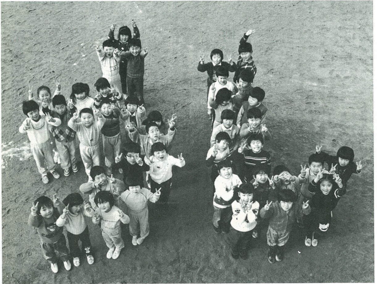
写真—新地保育所、かき組・もも組による今年のえと「うし、の」人文字