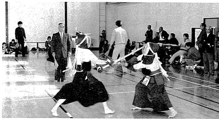
▲スポーツ少年団剣道クラブが山元町と親善試合 新地町、山元町少年剣道大会が12月2日、福田の勤労青少年ホームで開かれました。この大会は、県境を越えた山元町の小・中学生との交流を図ろうと一昨年から行われているものです。試合は、個人戦と団体戦で行われ、豆剣士たちは鋭い気合で熱戦を展開。小学生の部は、山元勢が強かったものの、中学生は個人、団体とも新地勢が圧倒しました。