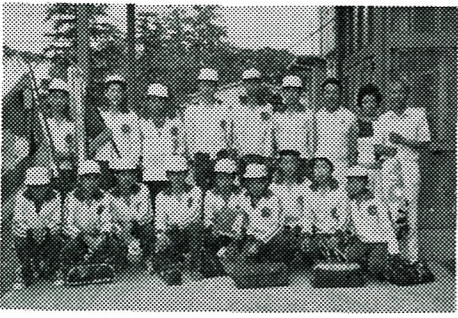
県大会で優勝したバレー部

優勝したバレー部はこのあと、八月五日仙台市で行われた東北大会、八月十八日から二十一日まで東京で行われた全国大会に出場しましたが二回戦・三回戦でそれぞれ惜敗しました。