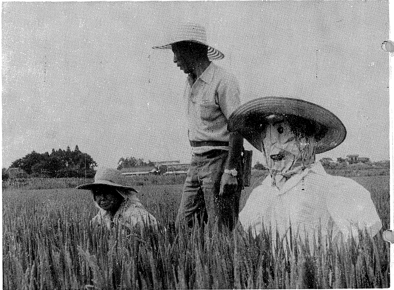
とじておきましよう。