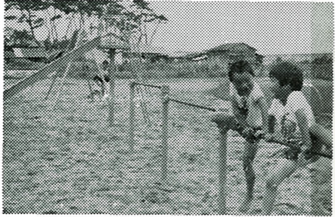
新設された子供のあそび場(今泉)

試合結果は、次の通りです。 準決勝 漁協 A 7-13 杉目 消防分署 8-4 漁協 B 決勝 消防分署 6-2 漁協 A