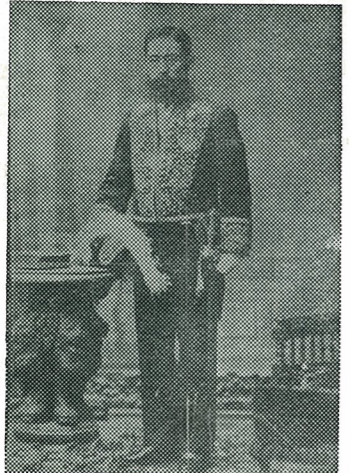
高野孟矩(左)と、大木喬任(右)の合影。

「台湾高等法院長」となり、硬骨漢として名を馳せた高野孟矩は中島出身である。 安政元年(一八五四年)一月二十三日に巨野藩主伊達藤五郎の家臣高野直直の三男に生れ、幼名を繁太郎と名づけた。 五歳から漢学を学び、十三歳で剣術を一丸兼三郎に、槍術を安戸多門について修業した。 十五歳のとき、鳥羽伏見の変が起り、仙台藩の兵として出陣した。十六歳まで家庭にあって漢学を研究、また歴史に親しんだ。さらに氏家閑存、土生柳平について経子文章を学んだ。 この間、たびたび鹿狼山の座禪洞にひとりこもって勉強した。その後角田県立学校で漢学、警前県立学校で英語を学んだ。一時警前県庁に勤めたがうつ病に悩む。地方に埋もれることに満足せず、大志を抱いて明治六年(二十一歳)に上京。このとき東京ま