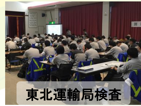
東北運輸局検査 平成28年5、9月