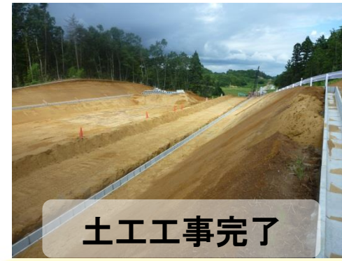
土工工事完了 平成26年9月