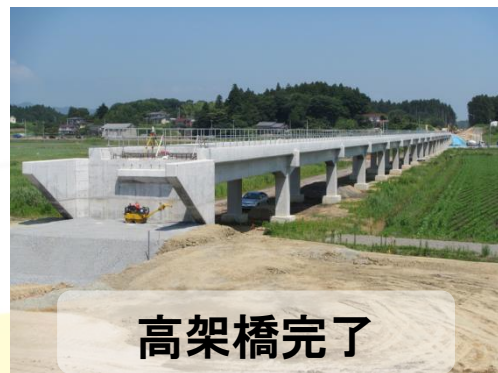
高架橋完了 平成27年9月