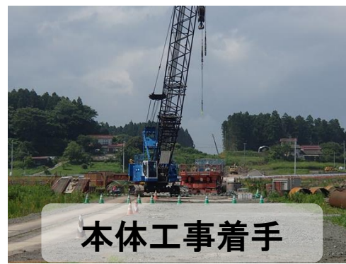
本体工事着手 平成26年7月