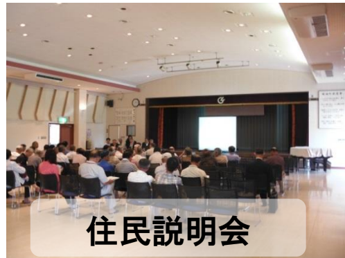
住民説明会 平成24年6月