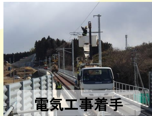
電気工事着手 平成27年11月