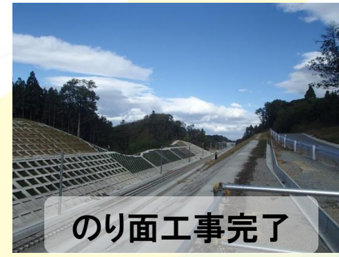
のり面工事完了 平成27年9月