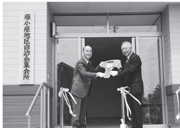
▲左から横山区長、加藤町長

また、加藤町長が「第9行政区の絆が集会所で深まることを期待しています。」とあいさつし、横山区長が「自治会の輪が広がって住民が楽しく生活できるようになればと思います。」と話しました。