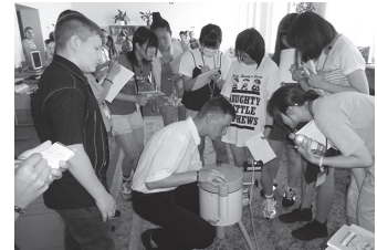
▲放射性物質の測定器

ベラルーシ共和国…東欧バルト三国やポーランドのお隣。公用語はベラルーシ語。1991年ソビエト連邦崩壊に伴い独立。1986年には共和国南にあったウクライナの最北部にてチェルノブイリ原発事故が発生。放射性物質が共和国に降り注いだ。