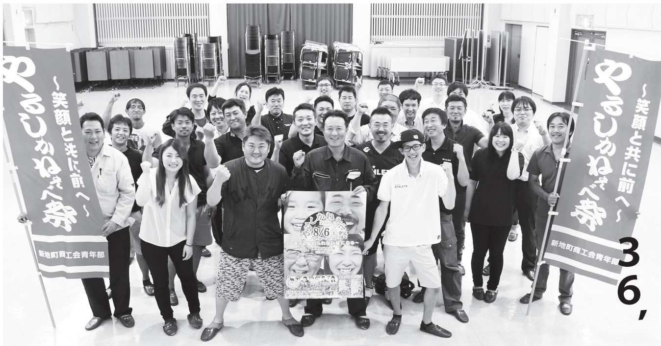
第6回やるしかねえべ祭実行委員会