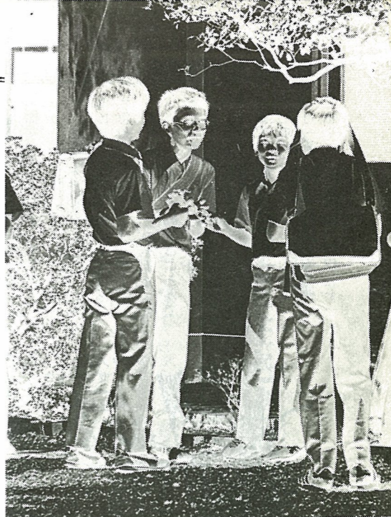
社会を明るくする運動 7月1日～31日