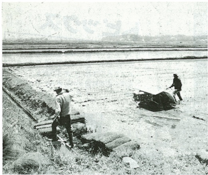
一ほ場整備された水田での田植え作業— 規模拡大と経営安定に制度資金をご利用ください。 ご相談は農業委員会へ。

農業委員会では、農業の規模拡大と経営安定のために各種制度資金のあっせんを行っておりますので、お気軽にご利用ください。