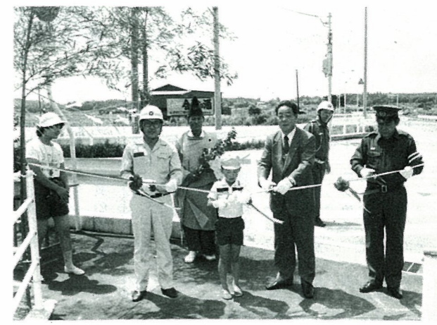
▶待望の駒ヶ嶺歩道橋が完成 交通事故多発地帯であった駒ヶ嶺に、工事費4,230万円かけられ7月18日歩道橋が立派に完成。この日を待ち望んでいた駒ヶ嶺保育所園児らが渡り始め、完成を祝った。