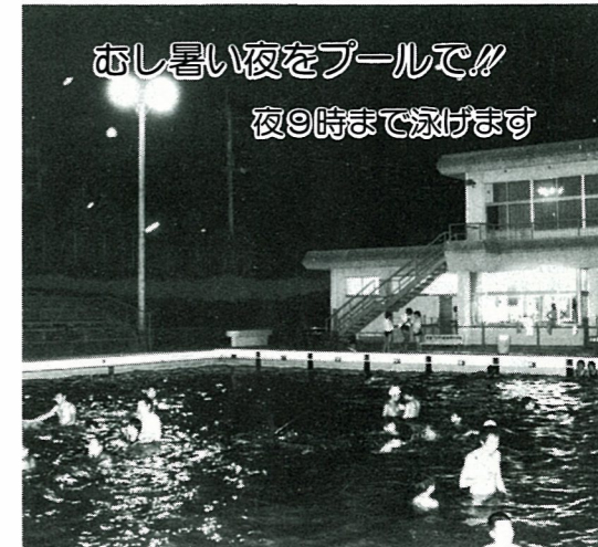
▲勤労者プールのナイターは8月19日までオープンしています。