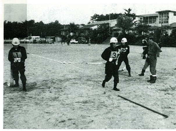
▲ポンプ操法大会に向けて早朝訓練にはげむ第1分団第2部消防団員 7/24 相馬地方ポンプ操法大会に出場する第1分団第2部(中区)と第3分団第10部(作田)は、6月中旬から毎朝5時から厳しい訓練。