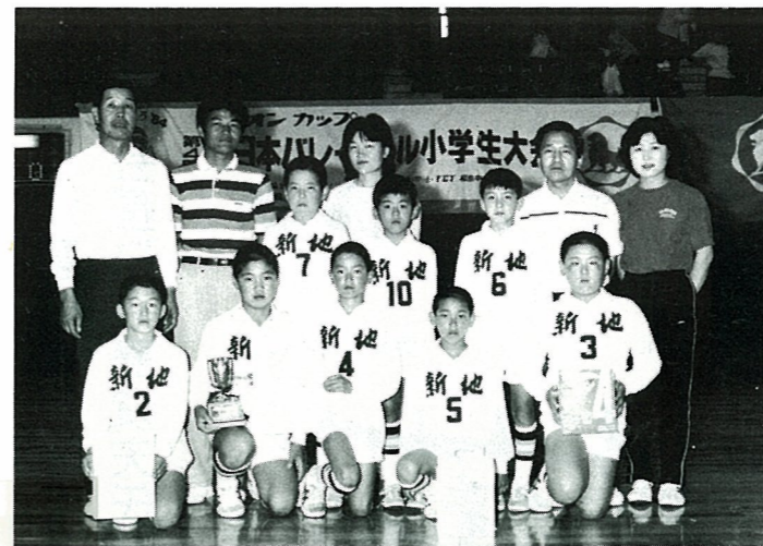
▲新地小バレー部(男子)県大会優勝 第4回全日本バレーボール小学生大会の県大会が7月8日福島市の福島体育館で開かれ、堅い守備と基本に忠実な新地小が決勝で油井小(伊達町)を2対0で破り初優勝。8月14日~17日に東京・駒沢体育館で開かれる全国大会に出場することになった。