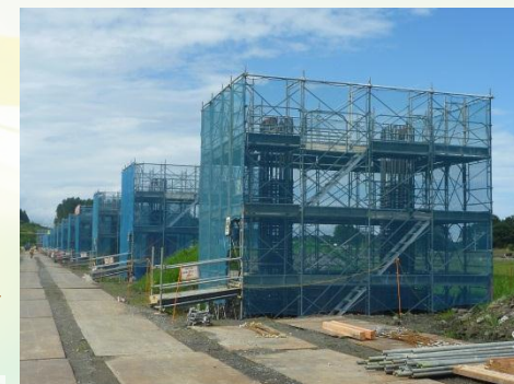
高架橋の柱構築工事の開始