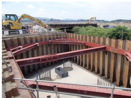
橋台構築の準備完了