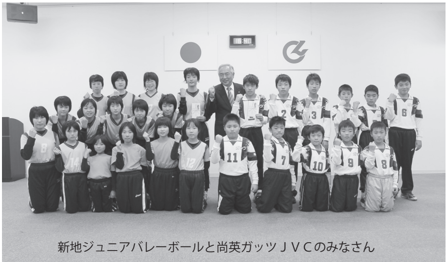
新地ジュニアバレーボールと尚英ガッツJVCのみなさん