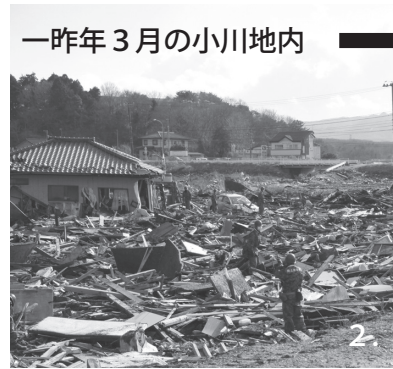
一昨年3月の小川地内